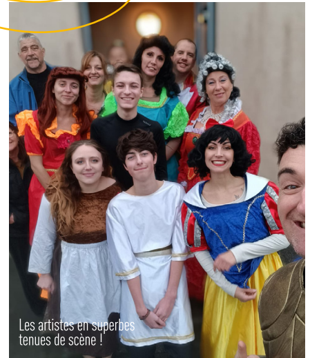
Les artistes en superbes tenues de scène !

LE SECRET de la longévité : des amateurs PASSIONNÉS