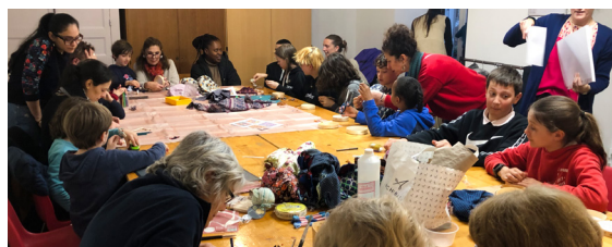
Les ateliers du BarBeau

Dès le début, Le BarBeau a choisi de fonctionner sans présidente unique. L'association est organisée en commissions (communication, logistique, événements...), avec des référentes tournantes. Une gouvernance horizontale qui permet à chacune d'apporter ses compétences et d'assurer la supervision des projets.