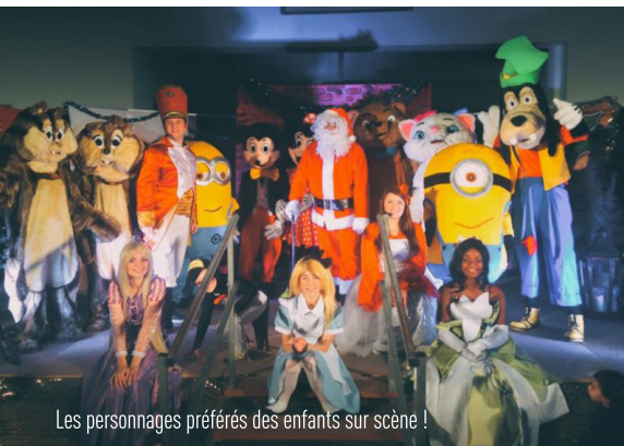
Les personnages préférés des enfants sur scène !

L' Amicale Laïque de Poigny a fêté en 2024 ses 50 ans d'existence. D'abord Foyer Rural, l'association a évolué au fil des années pour devenir un acteur incontournable de la vie culturelle du village de Poigny (530 habitants). Créée par des bénévoles et soutenue par l'ancien maire, elle a vu passer de nombreuses activités : ping-pong, tennis, club des anciens et aujourd'hui trois sections majeures qui rassemblent près de 130 adhérents.